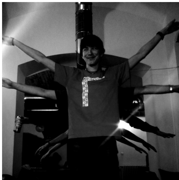
Exkluzivní fotografie pořízená tajnou kamerou na zkoušce souboru.